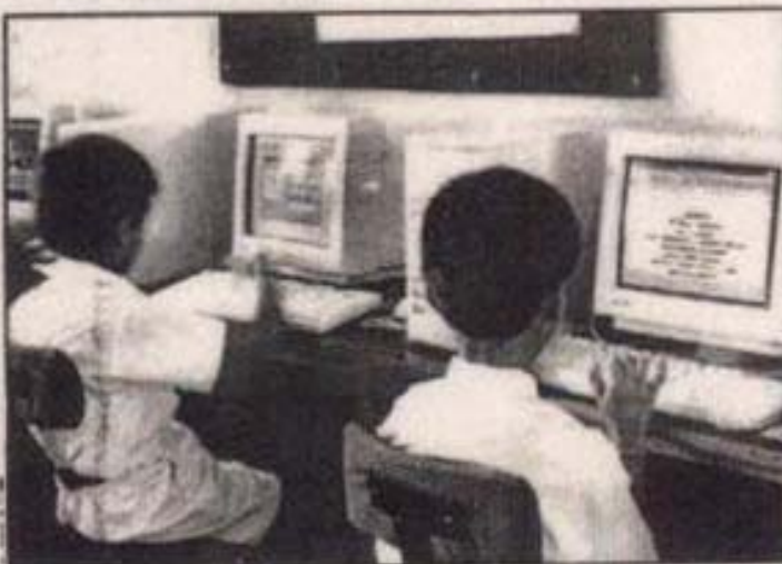
બાળકની ખામીને ધ્યાનમાં રાખીને એને ભણાવવામાં આવે તો એ કોઈ પણ વિષયમાં પારંગત થઈ શકે છે.